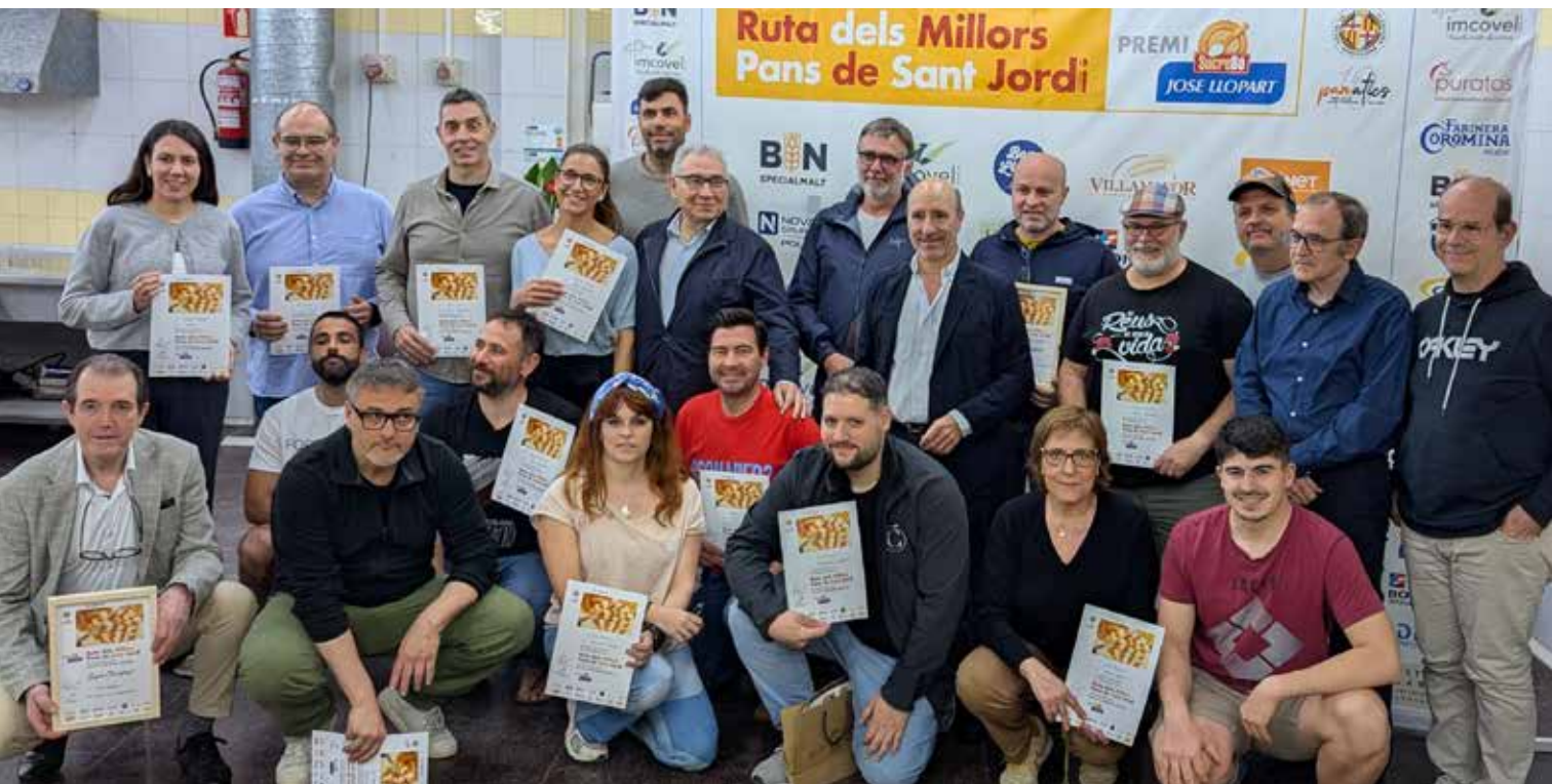
FOTO DE GRUPO, EMPRESAS I Y TODOS LOS SELECCIONADOS PARA LA RUTA