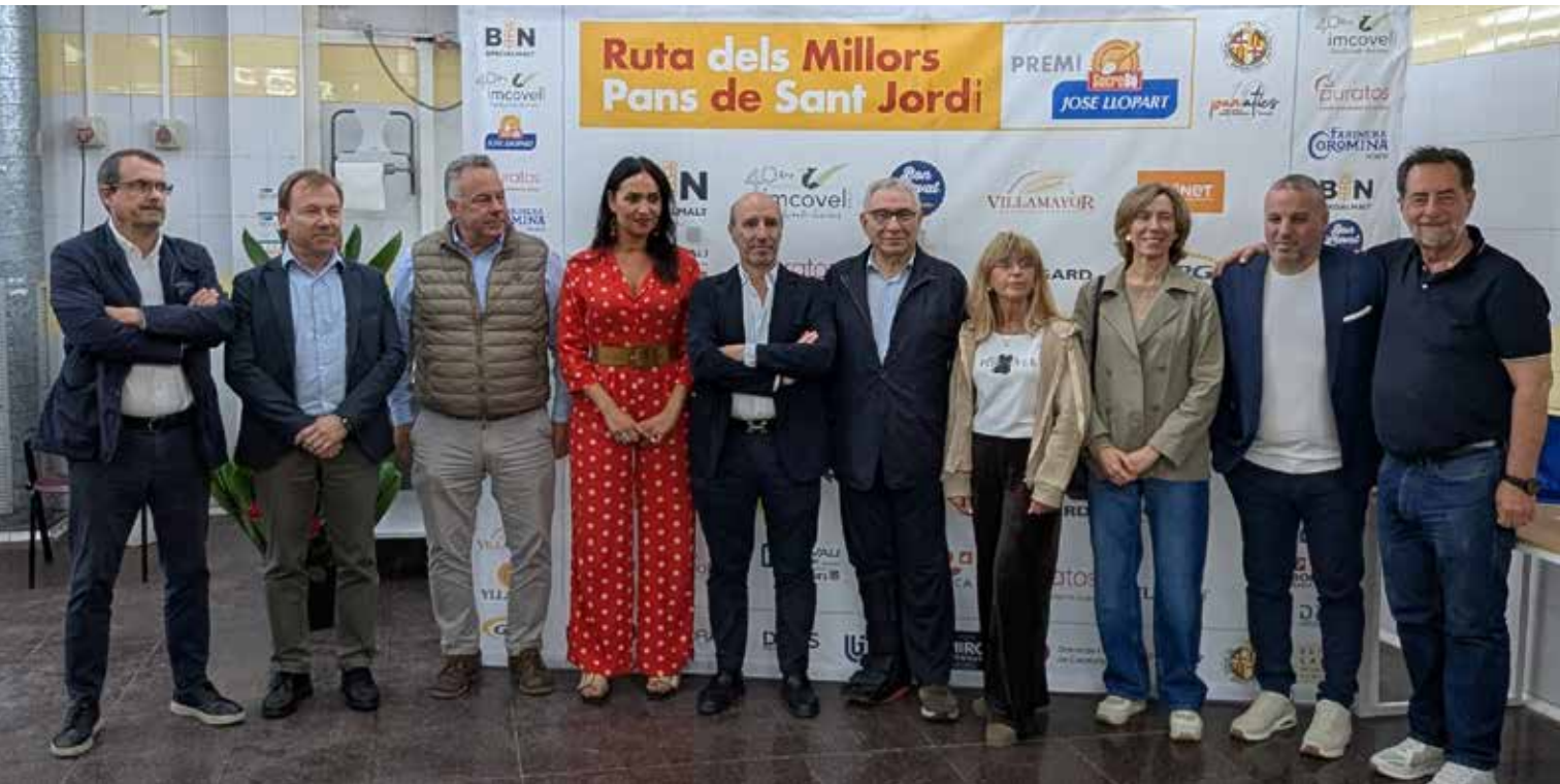
FOTO DE GRUPO, EMPRESAS PATROCINADORAS